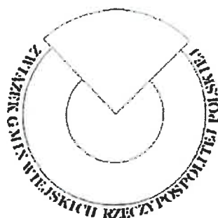
Logotyp monochromatyczny z napisami