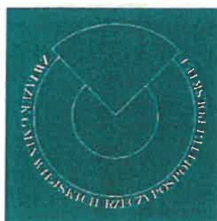
Logotyp monochromatyczny na ciemnym tle

Przewodnicząca XXXVI Zgromadzenia Ogólnego Związku Gmin Wiejskich Rzeczypospolitej Polskiej