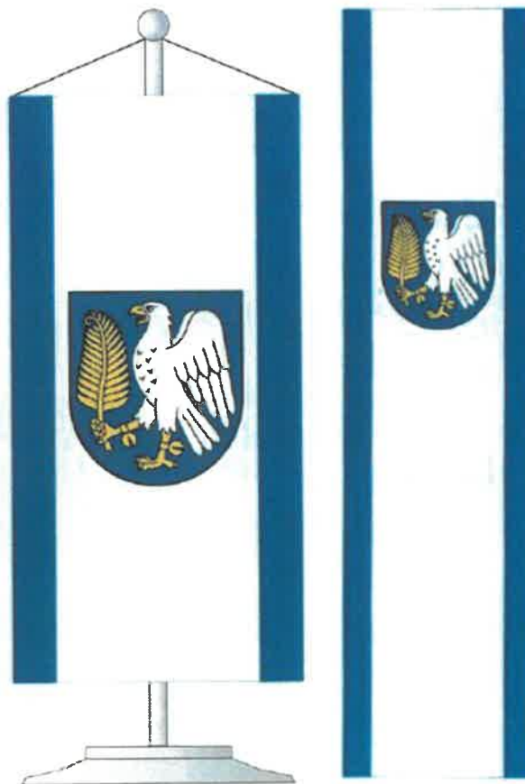
Flaga stolikowa i banner Gminy Galewice