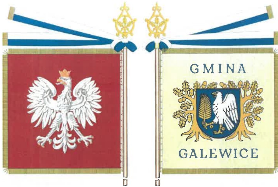
Sztandar Gminy Galewice

URZĄD GMINY W GALEWICACH Wpłynęło dnia 07. 06. 2024 Nr. 4855.zal. B