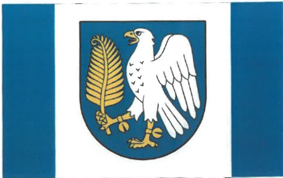
Flaga Gminy Galewice