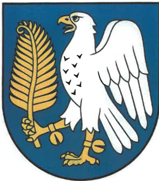
Herb Gminy Galewice

Wzory pozytywnie zaopiniowanych symboli prezentuje się poniżej.