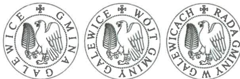
Pieczęcie Gminy Galewice